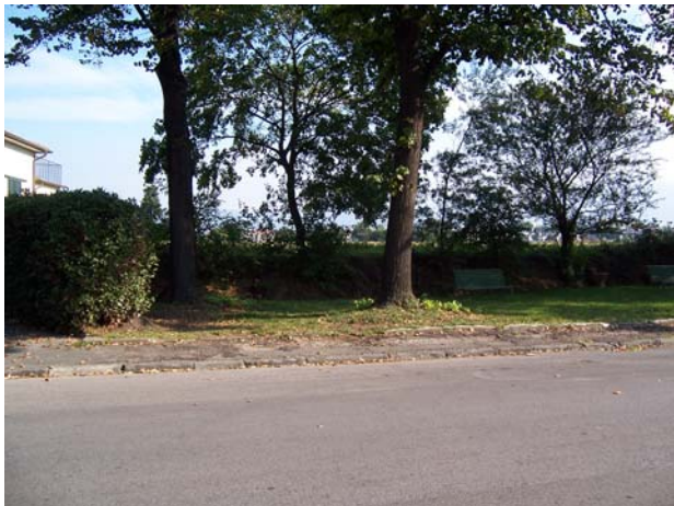
Marciapiede senza scivoli nel centro del paese