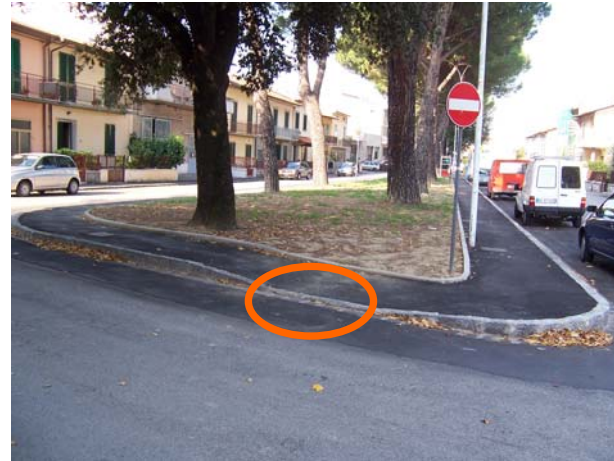
Un intervento recente