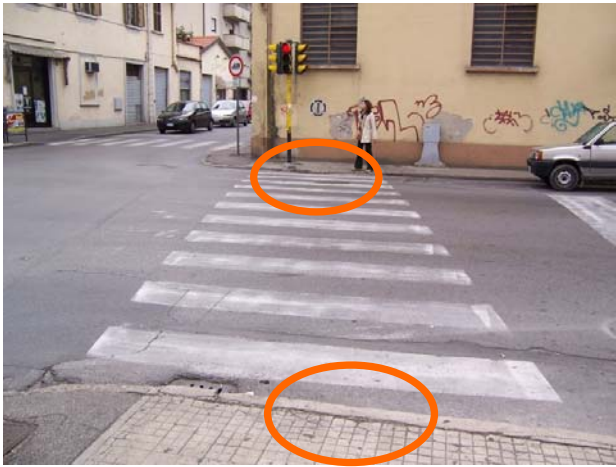
Attraversamento con scalino in Via Pistoiese