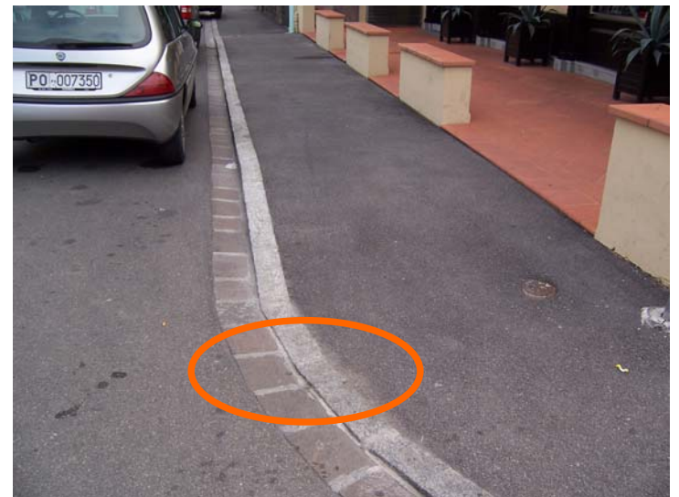
Interventi recenti in via Pasubio e via Adamello