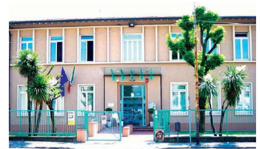
Circostrizione Prato Ovest Via Isidoro del Lungo, 12