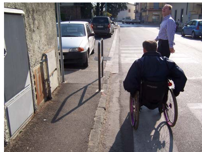
L'accesso alla nuova chiesa