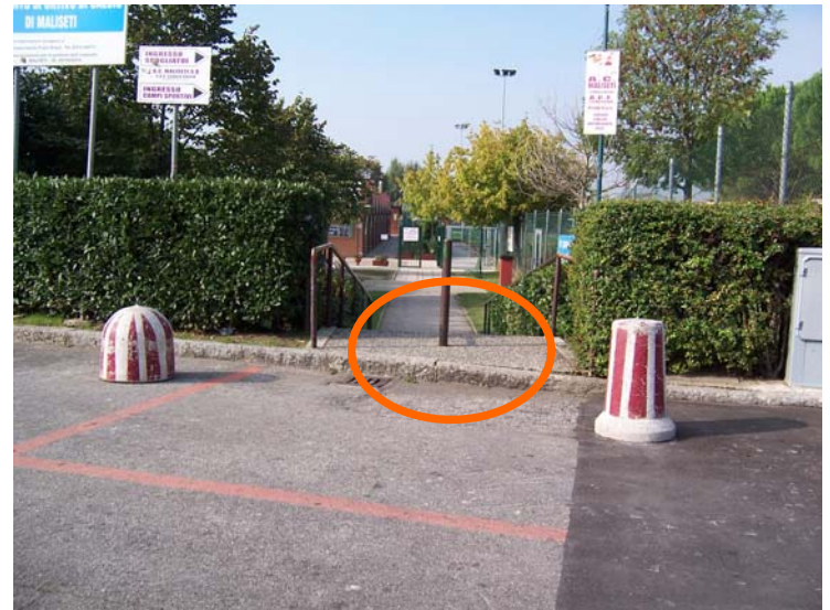
Giardino di via Ventura inaccessibile