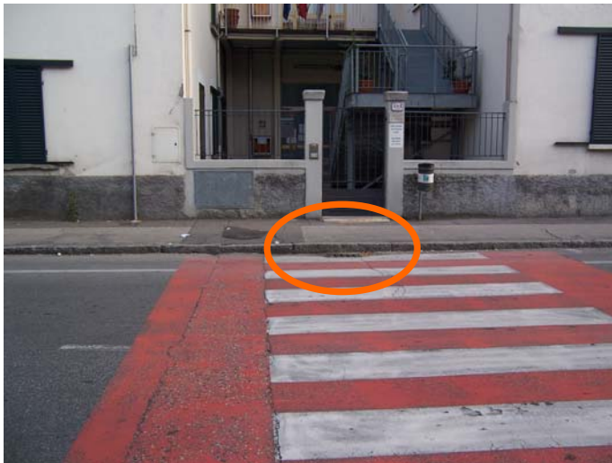
Attraversamenti con scalini in via Ortigara e via Pistoiese