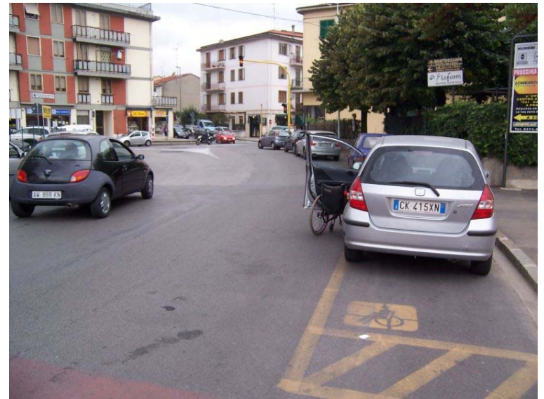
Parcheggio davanti alla nuova stazione FS di Borgonuovo