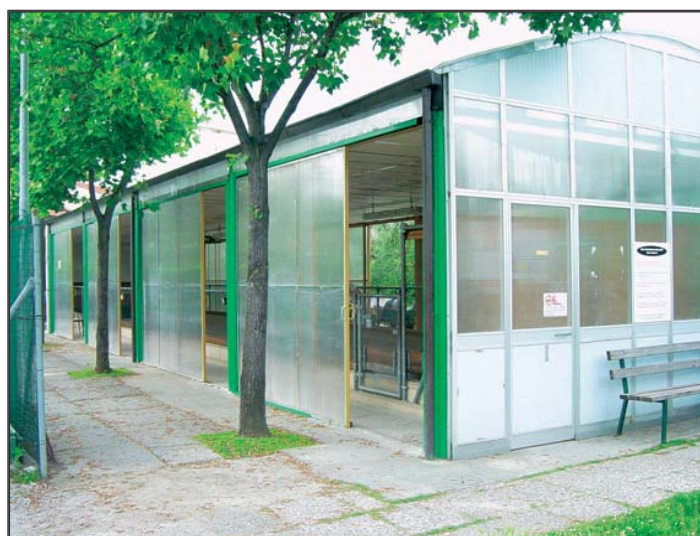
Bocciodromo di Maliseti A Maggio importante appuntamento " Torneo di bocce nonno e nipote "