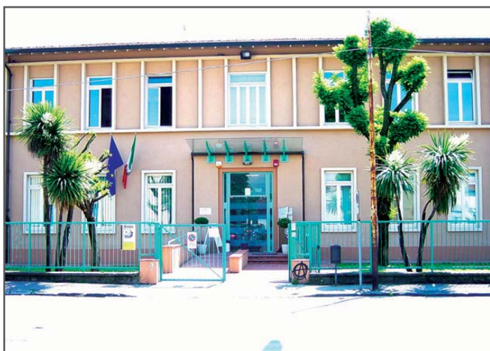
Sede della Circostrizione