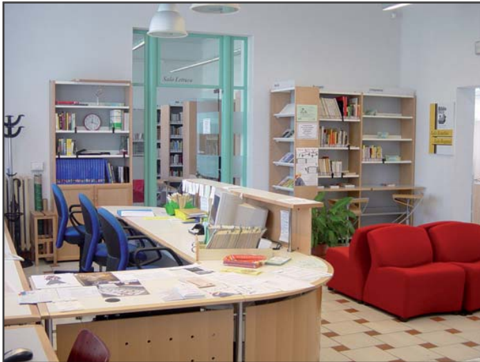
Biblioteca decentrata di Galciana

La Circoscrizione promuove da tempo una serie di progetti rivolti alle diverse fasce di età della popolazione, realizzando dei servizi con caratteristiche educative, ludiche, culturali per il tempo libero che sono diventati punti di riferimento per i cittadini.