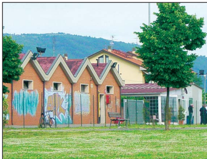
Veduta campo sportivo di Viaccia