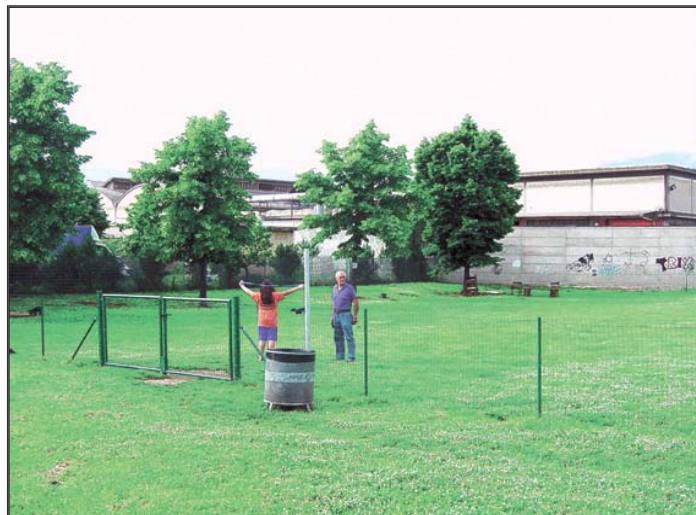
Area sgambatura per cani a Viaccia