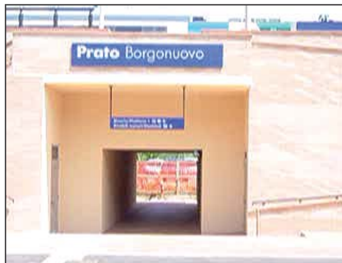
Fermata F.S. Borgonuovo "Opera indispensabile per tanti cittadini, studenti, lavoratori della Circoscrizione, che viaggiano tra Prato, Pistoia e Firenze"