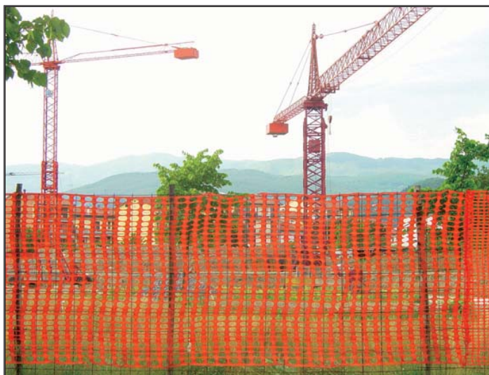
Cantiere della nuova Scuola Media di Maliseti