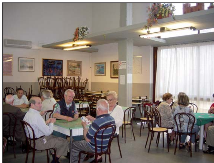
Un momento della giornata al Centro Sociale