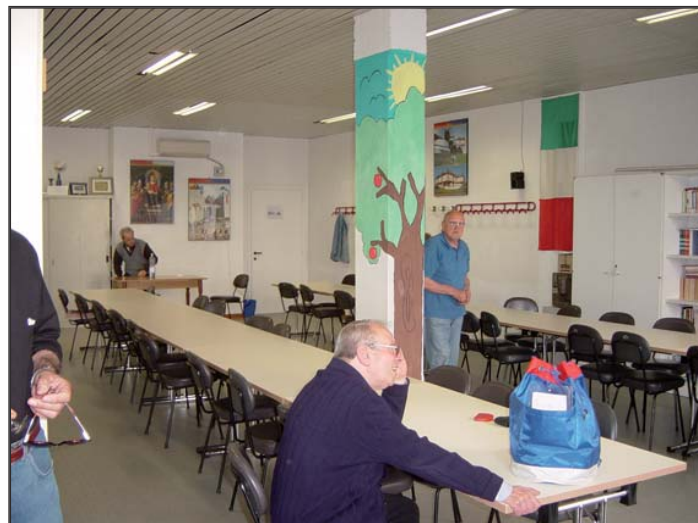
Un momento della giornata al Centro Sociale di Narnali